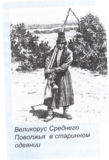
Великорус Среднего Поволжья в старинном одеянии