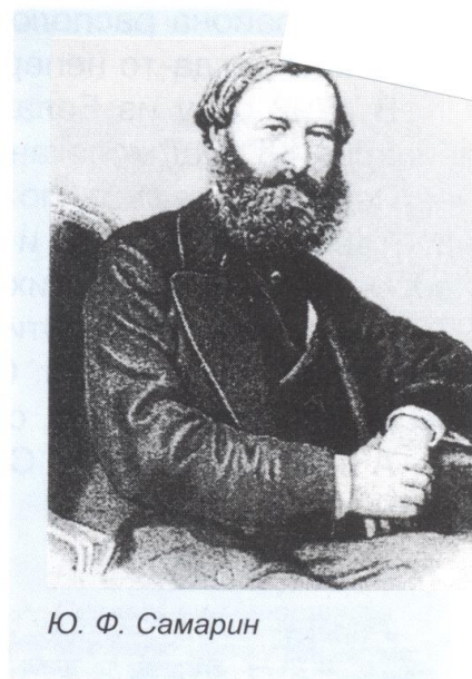
Ю. Ф. Самарин

Вряд ли здесь существовала какая-то последовательность. Все переселенцы селились группами около речки и основывали селения, спустя некоторое время к ним приходила другая группа семей. За ней третья и т. д., которые селились или вместе с первыми поселенцами в одном селении, или поблизости от него основывали новые селения. Многие из них постепенно соединялись, сохранив свое прежнее наименование.